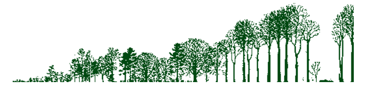
Ohne menschliche Eingriffe, Waldbrände oder schwere Stürme verwandelt sich die Heide im Zuge einer natürlichen Sukzession vom Krautstadium über das Pionier- und Zwischenwaldstadium zum Klimaxstadium. In diesem herrschen dann, standortabhängig, Buchen oder Eichen vor.