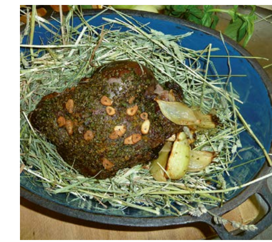
Wenn Heidschnuckenfleisch auf würzigem Heu gegart wird, gehen beide eine kulinarische Ehe ein.

Seit einigen Jahren kann man sich die Heide auch auf der Zunge zergehen lassen. Gaststätten in der Region bieten in den Osterwochen und während der Zeit der Heideblüte Heidschnuckengerichte an. Diese Schafe, die auch zur Landschaftspflege eingesetzt werden, ernähren sich hauptsächlich von den aufkommenden Birken und Espen. Auch Landreitgras und Heide verschmähen sie nicht. Deshalb ist ihr Fleisch fettarm und dunkel und für Diätkost geeignet. Ein frisch gezapftes Heidebräu aus dem Finsterwalder Brauhaus vervollständigt den Genuss. Dieses dunkle Bier erhält durch den Zusatz von Heidehonig seine besondere Note.