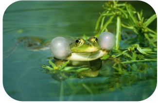
Teichfrosch - Friedheim Richter