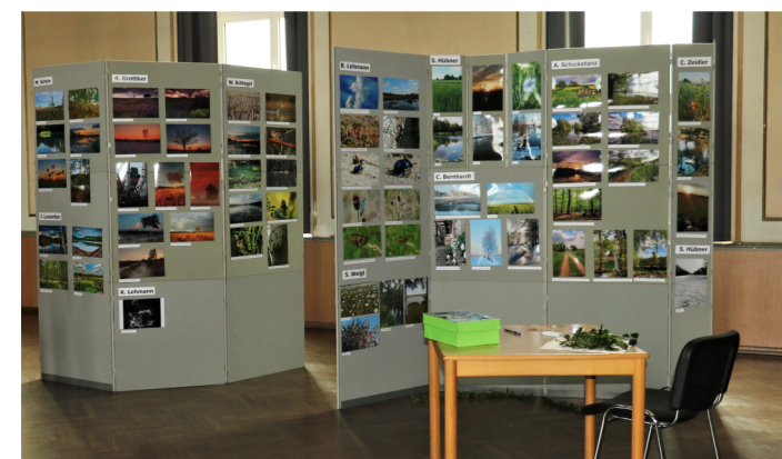
Fotoausstellung zum Naturparkfest - Cordula Schladitz