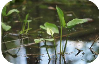
Sumpfcalla - Cordula Schladitz